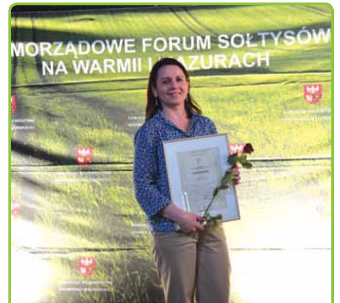
SOŁTYS, TO BRZMI DUMNIE