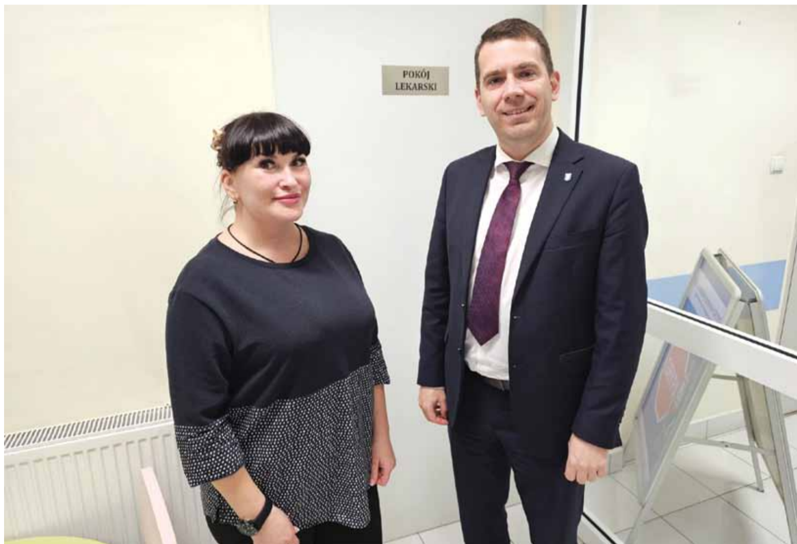
BURMISTRZ LIDZBARKA Z NOWYM LEKARZEM W PRZYCHODNI ZDROWIA W LIDZBARKU

Zdrowie jest jedną z najważniejszych wartości, dlatego też niezmiennie od początku mojej służby dla mieszkańców staram się o to dbać. Od wielu lat prowadzimy szereg badań profilaktycznych dla wszystkich grup. Staramy się by skierowane były one zarówno do tych najmłodszych mieszkańców, jak i tych starszych. W tym miesiącu po raz pierwszy przeprowadziliśmy badania profilaktyczne krwi dla Pań. Zainteresowani było tak duże, że już w tej chwili prowadzimy zapisy i prowadzimy rozmowy z fundacją na temat ich kolejnej wizyty. W listopadzie, podczas światowej akcji Movember, panowie mogli skorzystać z bezpłatnych badań z krwi w kierunku raka prostaty. Wtedy również z Fundacją Medycyny Prenatalnej im. Ernesta Wójcickiego przebadanych zostało 120 mężczyzn. Profilaktyka jest istotna i ona przede wszystkim pomaga zapobiegać ciężkim chorobom nowotworowym, które oby jak najrzadziej nas dotykały. Tego typu akcje są ważne i mają na celu zapobieganie chorobom i dbanie o swoje zdrowie. Od 2014 roku w mobilnych ambulansach przeprowadzonych został szereg przeróżnych badań profilaktycznych dla mieszkańców. W 2021 roku 120 mieszkańców miało okazję wykonać badania profilaktyczne RTG klatki piersiowej mających na celu wczesne wykrycie schorzeń układu oddechowego. Or-