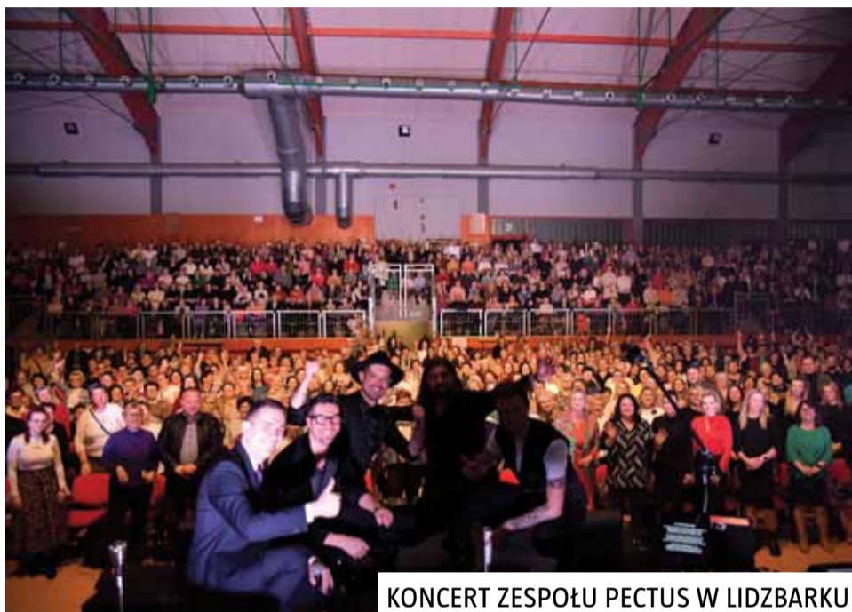
KONCERT ZESPOŁU PECTUS W LIDZBARKU

24 wydarzenia w przeciągu kilku intensywnych tygodni. Nasze Panie zdecydowanie potrafią świętować swoje święto.