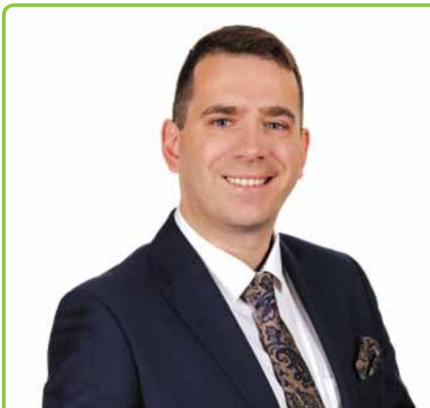
WYWIAD Z BURMISTRZEM LIDZBARKA MACIEJEM SITARKIEM STRONA 8-9