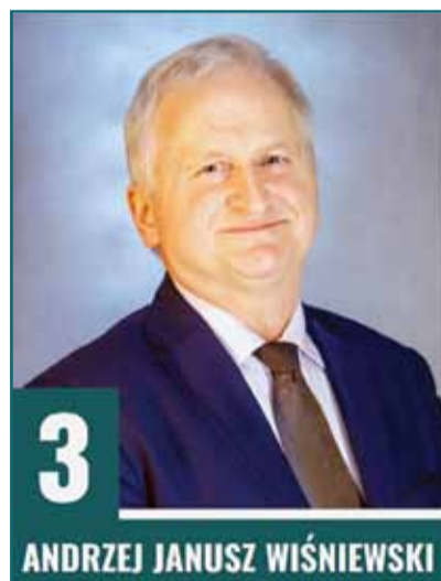
Zastępca Burmistrza Działdowa