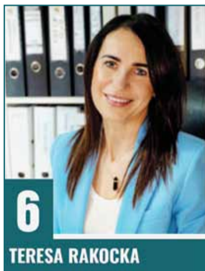
Dyrektor Niepublicznego Przedszkola Dwujęzycznego „Bajkowy Zakątek”

Sejmik Województwa Warmińsko-Mazurskiego składa się z 30 radnych. Wśród nich wybierany jest Przewodniczący, Zarząd i Marszałek Województwa.